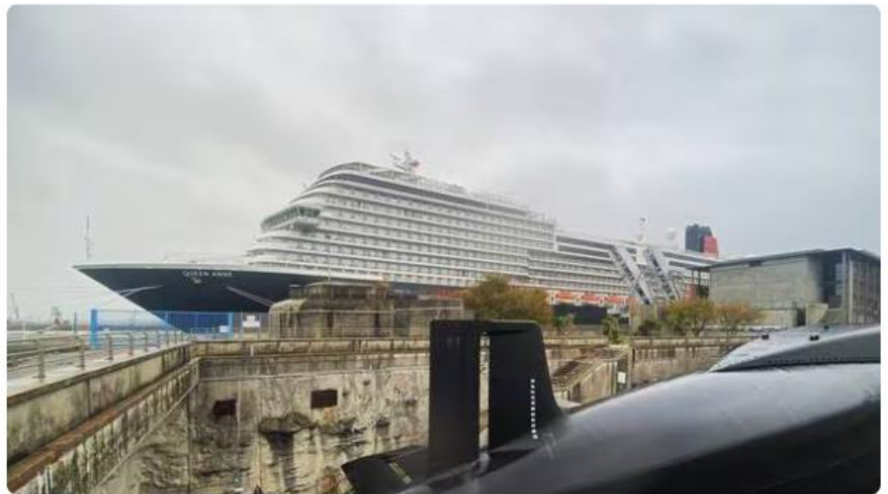
Le « Queen Anne » était de passage à Cherbourg pour une escale inaugurale, ici vu depuis La Cité de la Mer où est exposé le sous-marin « Le Redoutable ».

En escale inaugurale vingt ans après celle du Queen Mary 2 , le Queen Anne , baptisé à Liverpool en juin dernier, était amarré au quai de France, à Cherbourg, lundi 14 octobre.